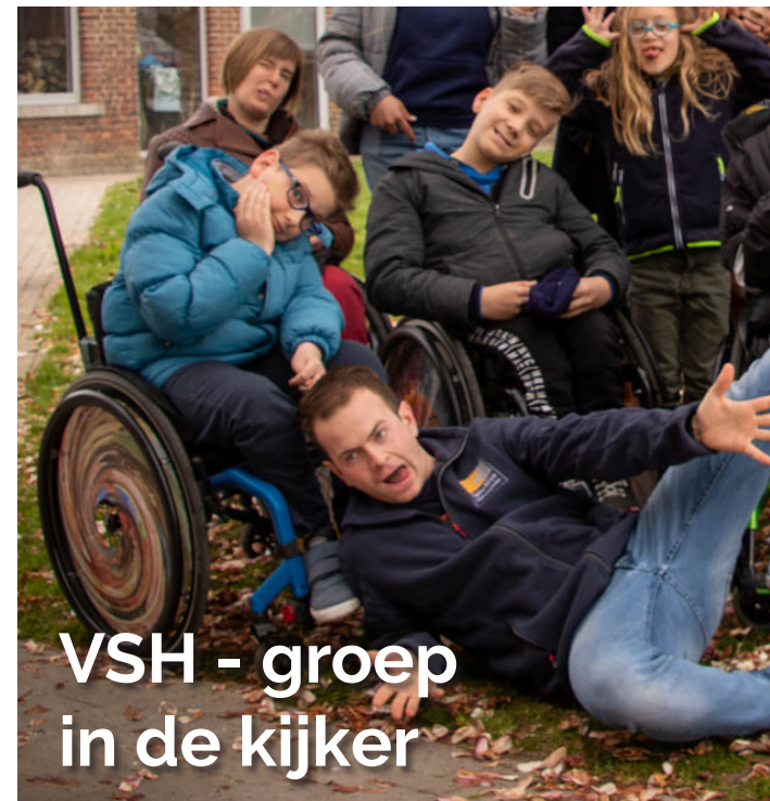
VSH - groep in de kijker