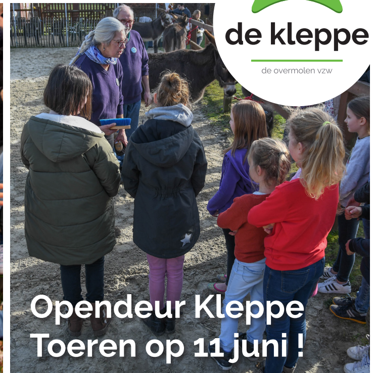
Opendeur Kleppe Toeren op 11 juni !